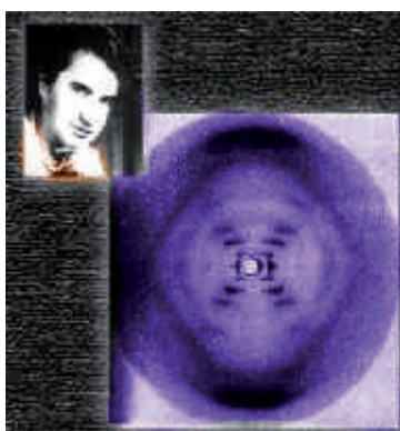
Primera radiografía de la famosa doble hélice de ADN; fotografía 51, tomada por Rosalind Franklin en 1953.

Esa imagen, conocida hoy como la famosa fotografía 51 fue clave para el descubrimiento de la estructura del ADN.